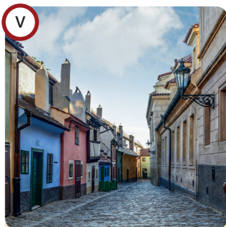
V Zlatá ulička / Golden Lane