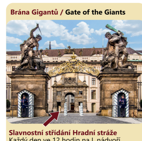
Brána Gigantů / Gate of the Giants