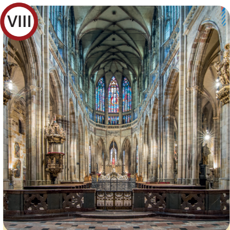
VIII Katedrála sv. Víta / St. Vitus Cathedral