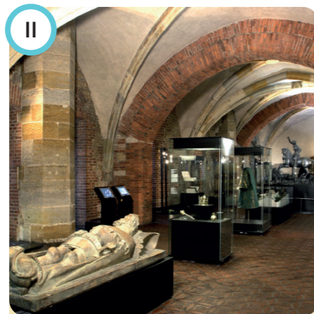
II Příběh Pražského hradu The Story of Prague Castle