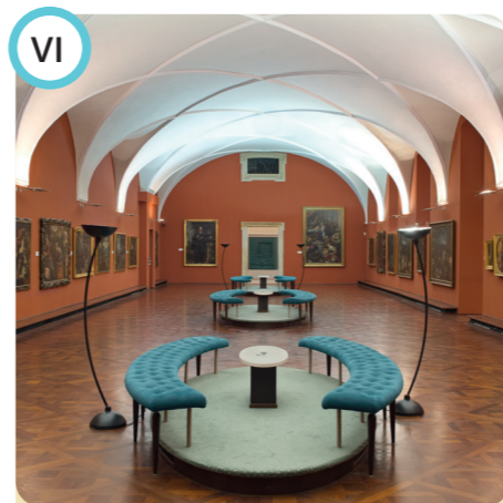
VI Obrazárna Pražského hradu Prague Castle Picture Gallery