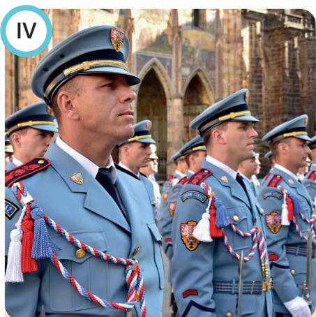
IV Stálá expozice Hradní stráže Castle Guard permanent exhibition