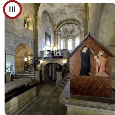
III Bazilika sv. Jiří St. George's Basilica