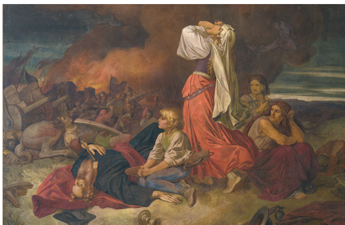
Bitva u Lipan roku 1434, 1862

Dějinnou koncepci cyklu nástěnných maleb stanovil v roce 1847 historik František Palacký. České dějiny měla reprezentovat tato témata: Přijetí křesťanství v Čechách roku 871, Břetislav I. s ostatky sv. Vojtěcha v Praze roku 1039, Bitva u Chlumce roku 1126, Přemysl II. Otakar loučící se s Prahou roku 1278, Karel IV. předsedající veřejnému soudu, Jan Hus na koncilu v Kostnici roku 1415, Bitva u Domažlic roku 1431, Podpis kompaktát roku 1436, Jiří z Poděbrad na zemském sněmu 1465, Stavovská svatováclavská smlouva roku 1517, Rudolf II. jako přítel umění, Odchod exulantů z Čech roku 1627 (třináctá scéna měla představovat život vládnoucího císaře). Palackým zvolená témata byla roku 1848 jednomyslně odsouhlasena členy výboru Společnosti vlasteneckých přátel umění a 8. března 1849 je předložili předseda Společnosti Antonín ml., hrabě z Thun-Hohensteinu spolu s ředitelem pražské Malířské akademie Christianem Rubenem ke schválení panujícím císaři Františku Josefovi. Ten