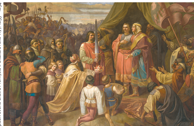
Vladislav se vzdává české koruny ve prospěch svého bratra Přemysla I. Otakara roku 1197, 1853–1864

císaři Františku Josefovi líbila a obratem je schválil (místo námětu ze současnosti však doporučil nějaké starší téma).